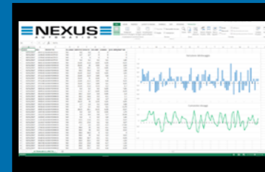
Rappresentazione misure effettuate con datatec Representation of some measurements taken with datatec