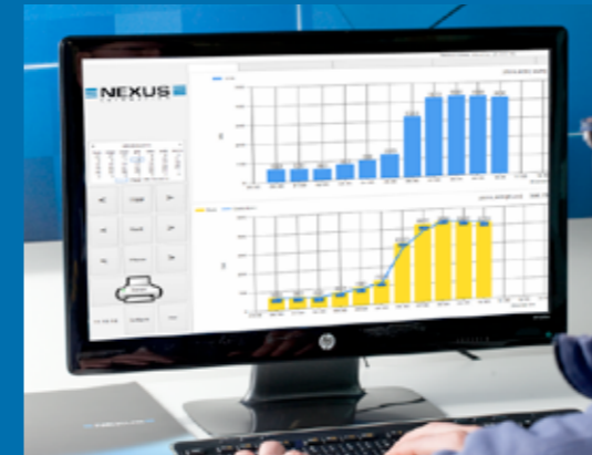
Come funziona datatec - Datatec operation