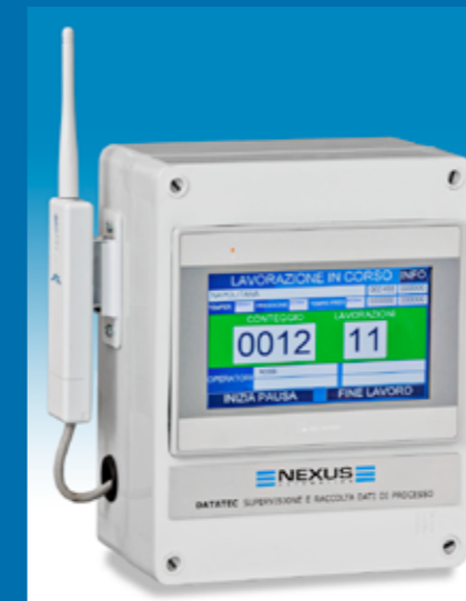
Modulo wireless per la supervisione e raccolta dati processo Wireless unit for monitoring and process data collection