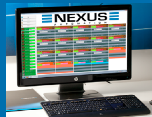
Schermata terminale - Stato botte Terminal screen - Drum status